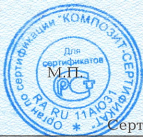
Схема сертификации 2с.